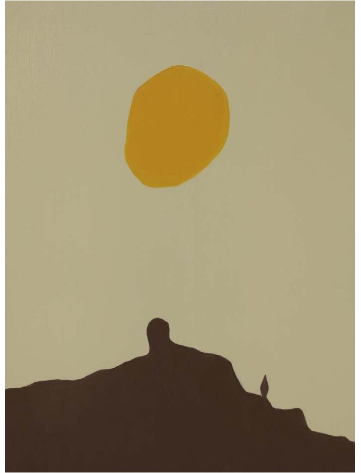
W3, z cyklu „Formy”