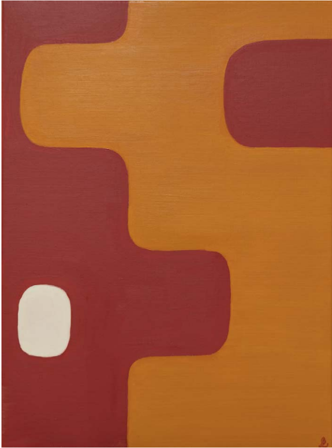
R4, cyklu „Formy”